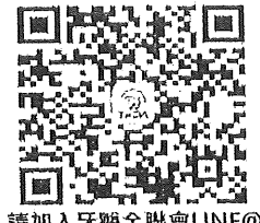
請加入牙醫全聯會LINE@

附件：財團法人藥害救濟基金會114年2月18日藥劑醫字第1145000432號函影本